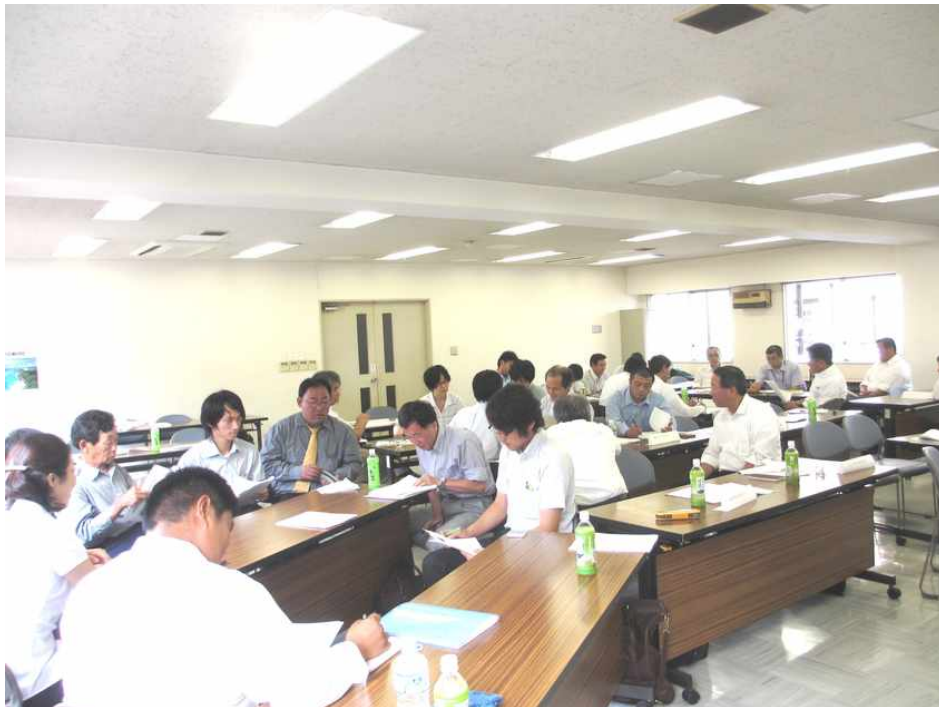
提起された事例について参加者がグループを作って熱心に議論